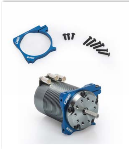
LRP WorksTeam Alum. Lüfterhalter