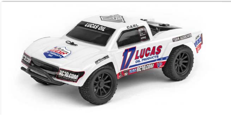
SC28 Ready-to-Run Lucas Oil Edition