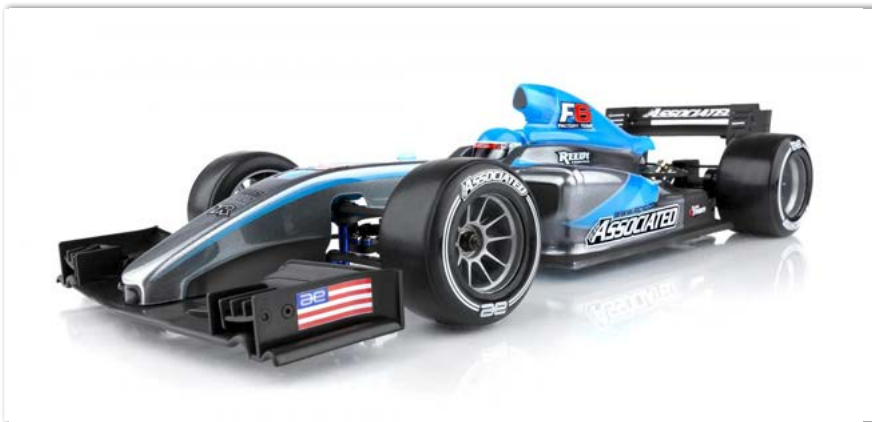
RC10F6 Factory Team Kit