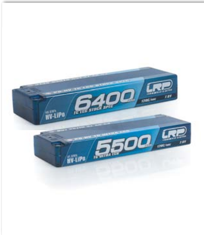
P5-HV TC LCG Stock Spec GRAPHENE 6400mAh P5-HV TC Ultra LCG GRAPHENE 5500mAh