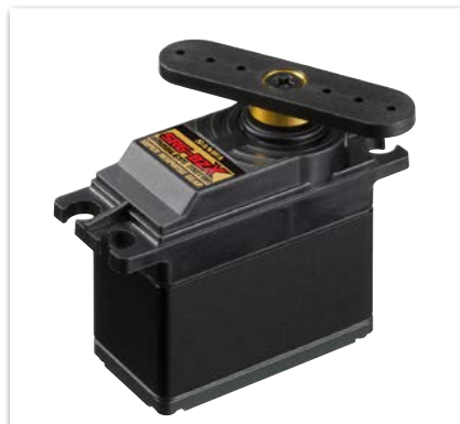
Sanwa SRG-BZX Servo (15kgcm/0.06s/40, 7.4V)