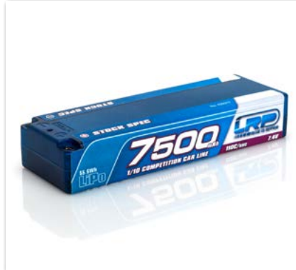
LRP 7500 - TC Stock Spec - 110C/55C - 7.4V LiPo