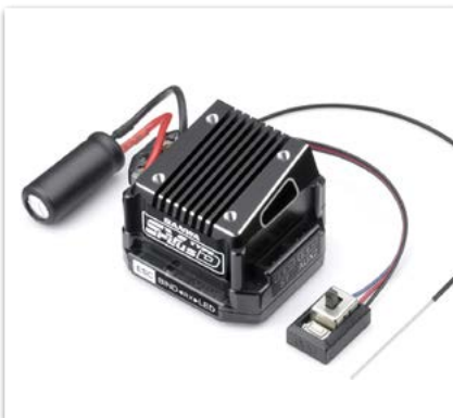
Sanwa SV-Plus Type-D Regler/ RX-472 Empfänger