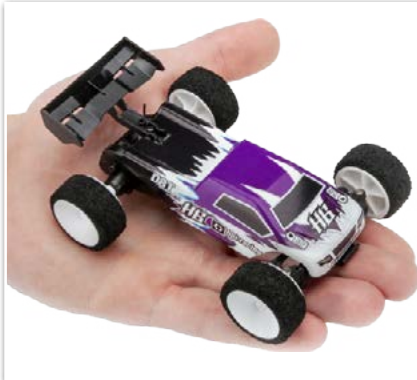
HPI Q32 D8T RTR Tessmann Edition 1/32 Truggy

LRP Aktuell Händlersuche unter: www.LRP.cc