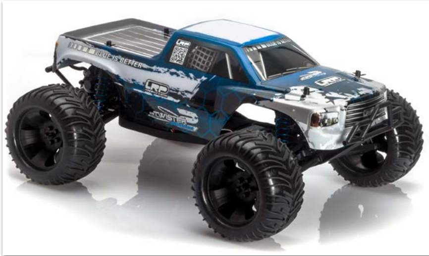
LRP S10 Twister 2 MT Brushless 2.4Ghz RTR

JETZT BEI DEM LRP AKTUELL HÄNDLER IN IHRER NÄHE