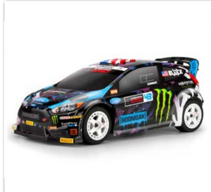
HPI Micro RS4 RTR Ken Block Ford Fiesta ST RX43