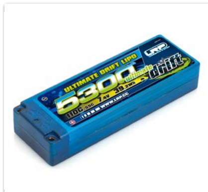
LRP LiPo Ultimate Drift 5300 - 110C/55C - 7.4V