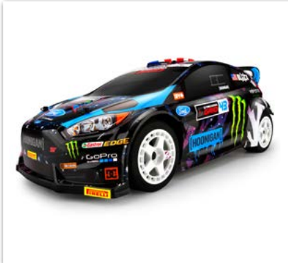
HPI WR8 Flux RTR Ken Block Ford Fiesta ST RX43

LRP Aktuell Händlersuche unter: www.LRP.cc