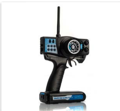
LRP B2-STX Pro 2.4GHz Fernsteuerungs-Set