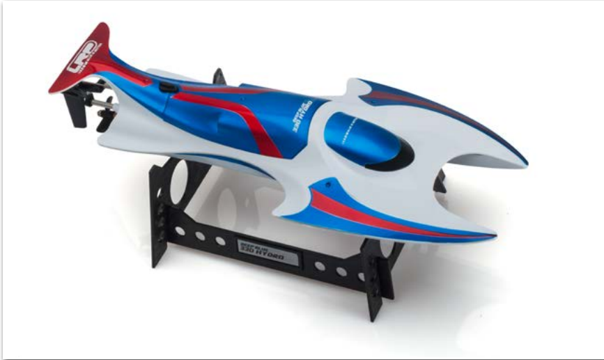
LRP Deep Blue 330 Hydro 2.4GHz Racing Boat RTR

JETZT BEI DEM LRP AKTUELL HÄNDLER IN IHRER NÄHE