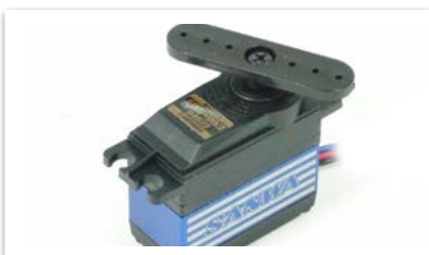
Sanwa ERS-963 Servo