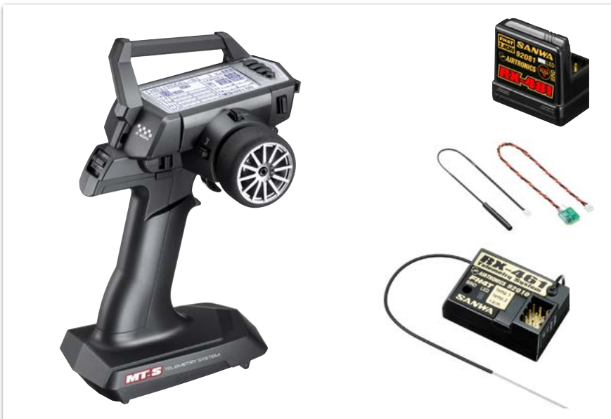
Sanwa MT-S Fernsteuerung mit RX-481 oder RX-461 Empfänger