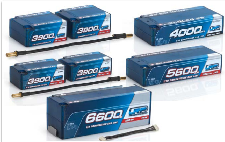
LRP Competition Car Line LiPo Akkus

JETZT BEI DEM LRP AKTUELL HÄNDLER IN IHRER NÄHE