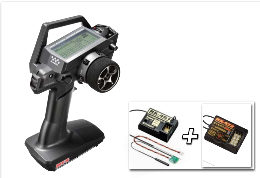
Sanwa MT-4 Set (TX+RX) + RX-472 Empfänger Combo