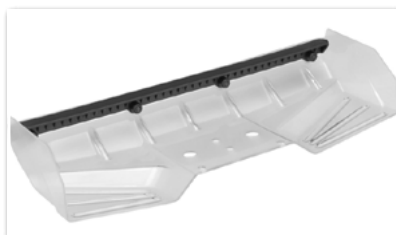
JConcepts Hybrid Flügel 1/8