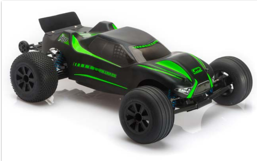
S10 Twister 2 Extreme-100 Brushless Truggy 2.4Ghz RTR

JETZT BEI DEM LRP AKTUELL HÄNDLER IN IHRER NÄHE