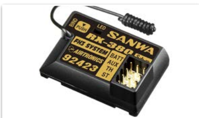
Sanwa RX-380 Empfänger 2.4GHz