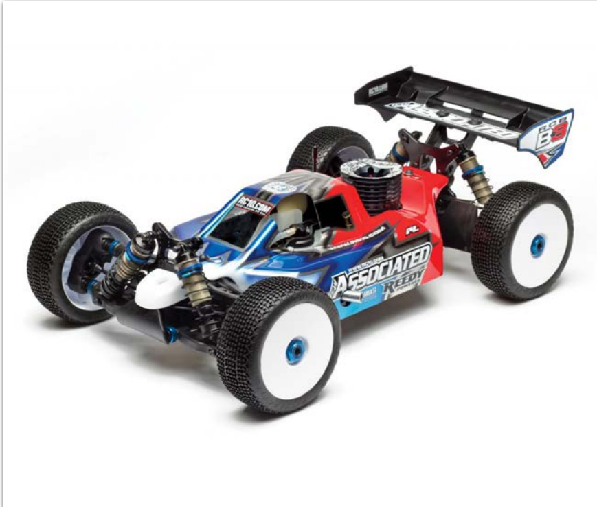
Team Associated - RC8B3 TEAM KIT - 1/8 4WD Buggy Nitro Competición

YA DISPONIBLES EN TU TIENDA DE HOBBY AKTUELL