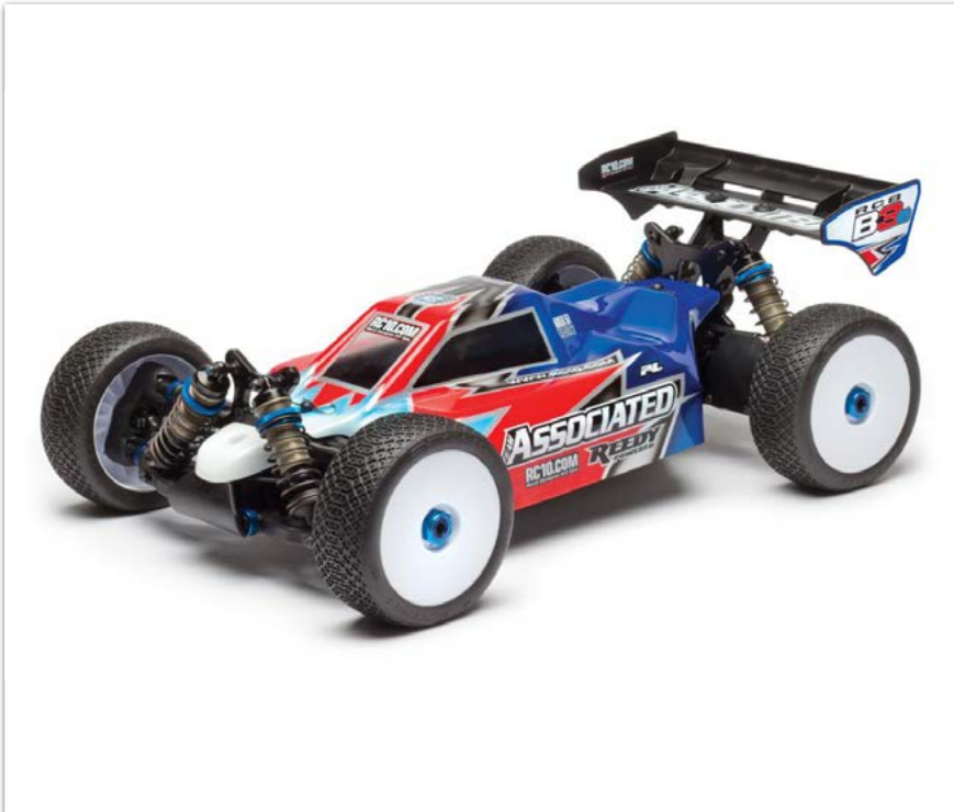
Team Associated - RC8B3e TEAM KIT - 1/8 4WD Buggy Eléctrico Competición