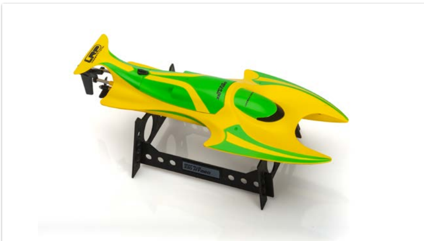
Lancha rápida LRP Deep Blue 330 Hydro 2.4GHz RTR amarillo neón/verde neón