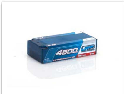
Batería LRP LiPo 4500 - Shorty P5