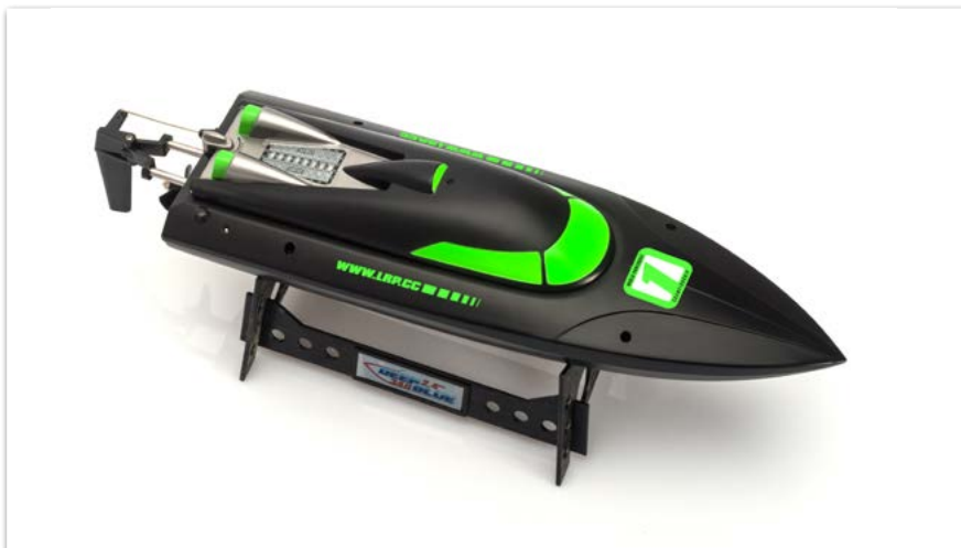
Lancha rápida LRP Deep Blue Racing 340 2,4GHz RTR negro/verde neón

YA DISPONIBLES EN TU TIENDA DE HOBBY AKTUELL