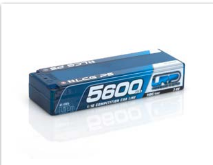
Batería LRP LiPo 5600 - TC LCG P5