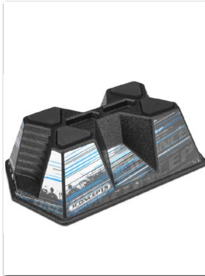
Soporte coche JConcepts