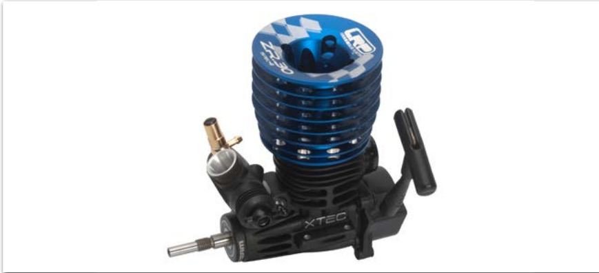
Motor LRP Nitro ZR.30 Spec.4 c/tirador

YA DISPONIBLES EN TU TIENDA DE HOBBY AKTUELL