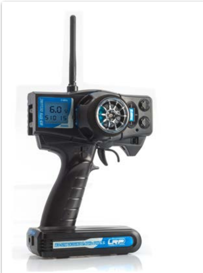
Emisora LRP B3-STX Deluxe 2.4GHz