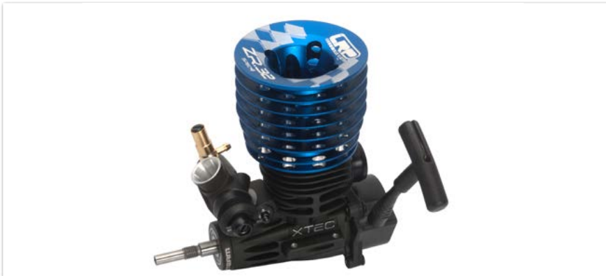
Motor LRP Nitro ZR.32 Spec.4 c/tirador